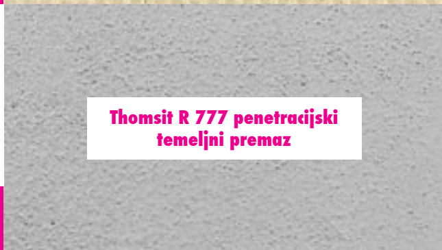
Thomsit R 777 penetracijski temeljni premaz